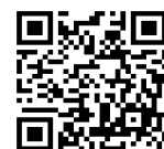
6月お申込みフォーム

※フォーム送信後訂正したくなった場合は、新しくフォームを入力・送信してください。新しい方を採用します。